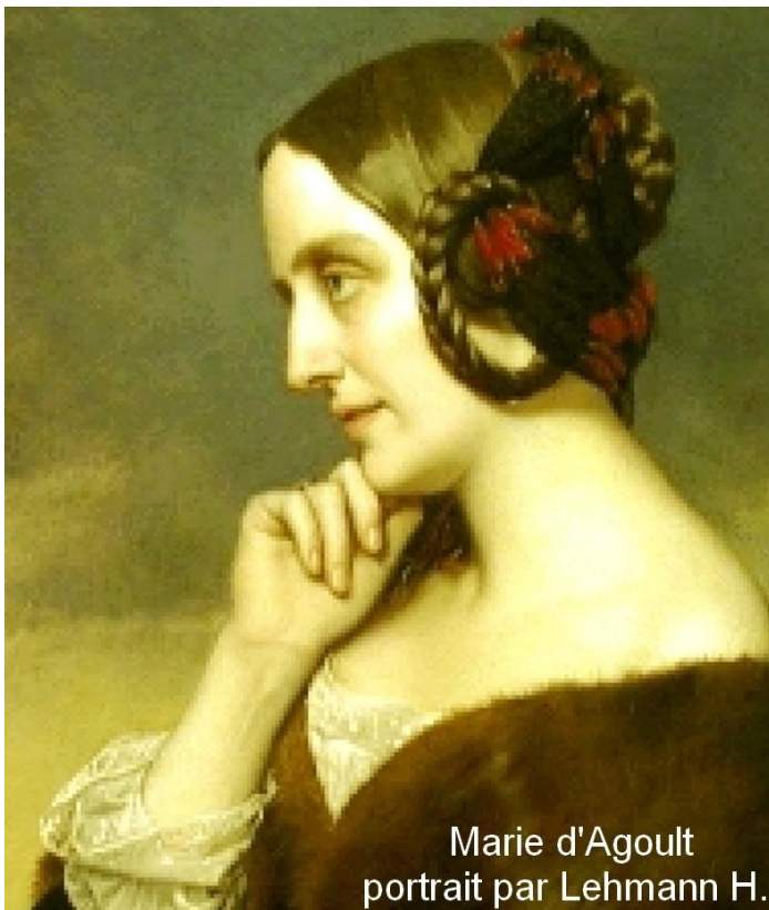
Marie d'Agoult portrait par Lehmann H.